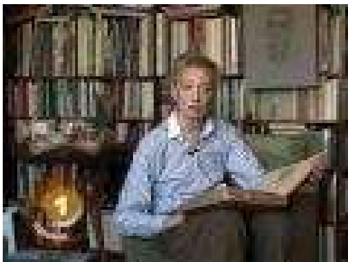
Kadar iz emisije Život na službenom putu

Projekcija TV emisije: ŽIVOT NA SLUŽBENOM PUTU (oktobar 2009.). Urednica: Dušica Pejović