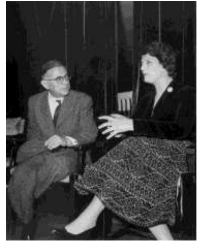
Na fotografiji: Žan Pol Sartr i Mira Trailović

Premijerno emitovano: 27. oktobra 1991. Trajanje: oko 50 min