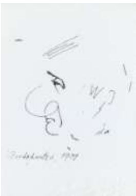
Jovan Ćirilov, Autoportret