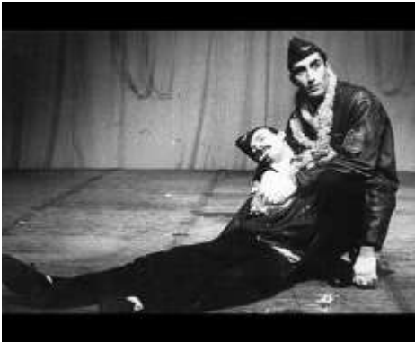
Scena iz predstave Misa u A-Molu, Ljubiše Ristića, 15. Bitef, 1981 (nagrađena predstava)

Projekcija filmova Bora Draškovića o radu Ljubiše Ristića i KPGT-a