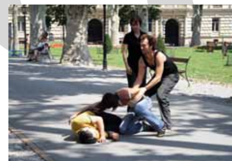
Igor Grubić: Zgodba z vzhodne strani / East Side Story / Priča sa Istočne strane , foto / photo, 2008.

Zgodba z vzhodne strani East Side Story Priča sa Istočne strane